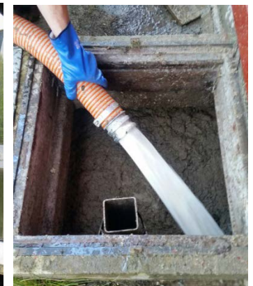
Wasserrückgabe in Sickergrube Water return in septic tank