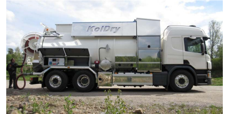
Sickergrubenentleerung mit KolDry Septic tank emptying with KolDry

The handling of the KolDry is very easy. With a camera mounted in the tank, the dewatering process can be monitored. The return of water takes place through the same hose, with which the septic tank was emptied at the beginning.