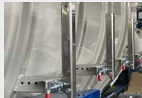
Putkien ja letkujen pidikkeet